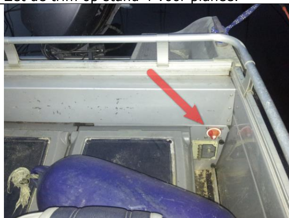
Zet de hoofdschakelaar aan/uit.