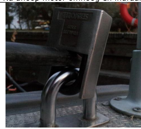
Na afloop slot zo vast maken.