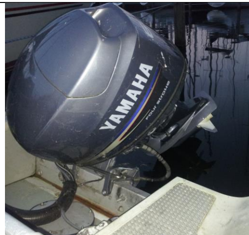
Na afloop motor omhoog en indraaien.